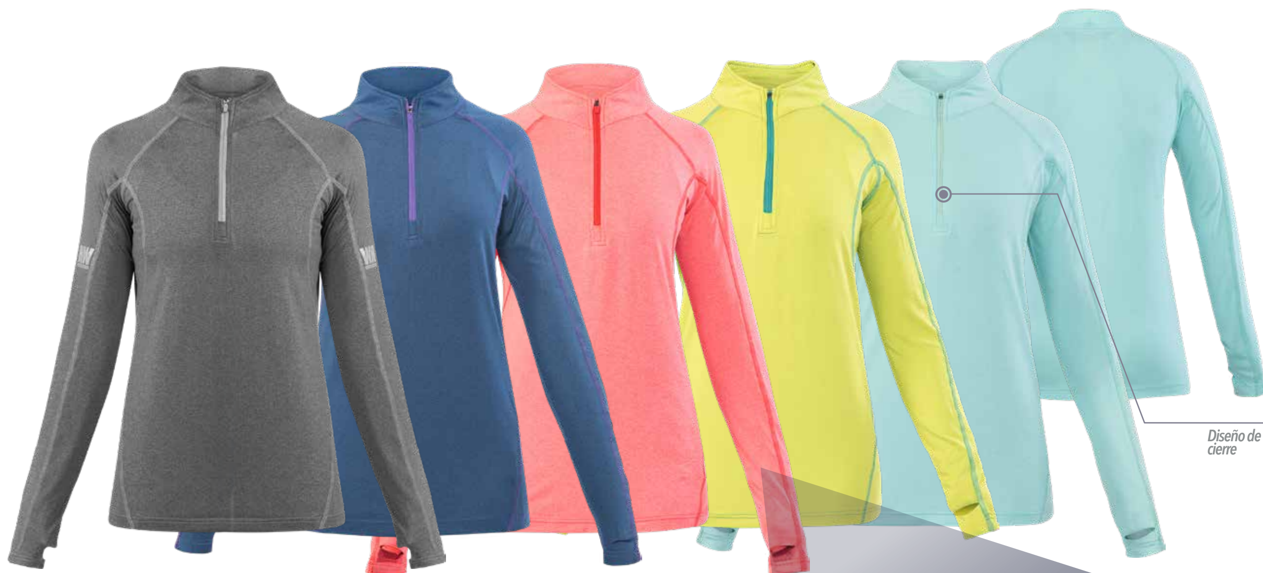
Diseño de medio cierre

Polera manga larga de medio cierre / Ultra respirable / Tecnología QuickDry / Calce fit para mayor comodidad y movilidad.